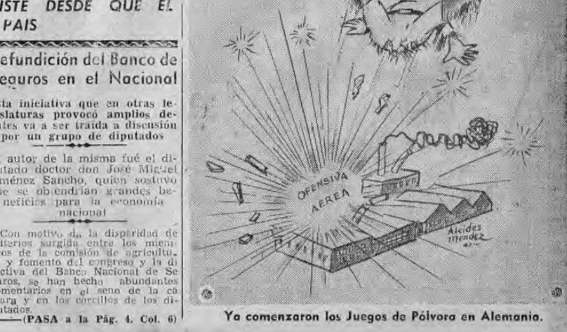
Ya comenzaron los Juegos de Pólvora en Alemania.