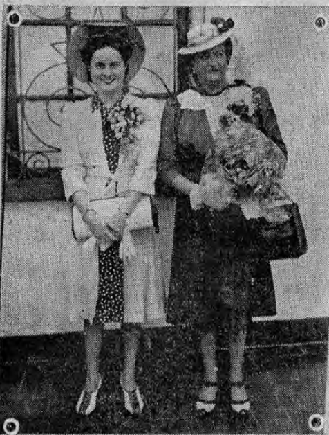
Doña Salvadorita Debayle de Somoza, Primera Dama de Nicaragua, acompañada de su hija, Lilliam Somoza Debayle, Novia del Ejército de Nicaragua. (Pose especial de las gentiles viajeras para LA TRIBUNA, a su paso por La Sabana).

LE DIJO DOÑA SALVADORITA DEBAYLE DE SOMOZA AL SR. PRESIDENTE DE LA REPUBLICA, AL DESCENDER AYER DEL AVION QUE LA CONDUJO A COSTA RICA.—CORDIAL RECIBIMIENTO SE LE TRIBUTO A LA SEÑORA DE SOMOZA Y A SU HIJA, LA SEÑORITA LILLIAM, "REINA DEL EJERCITO DE NICARAGUA"